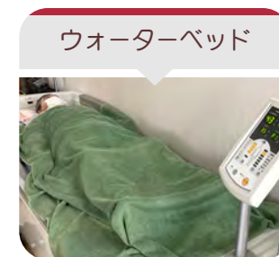
ウォーターベッド